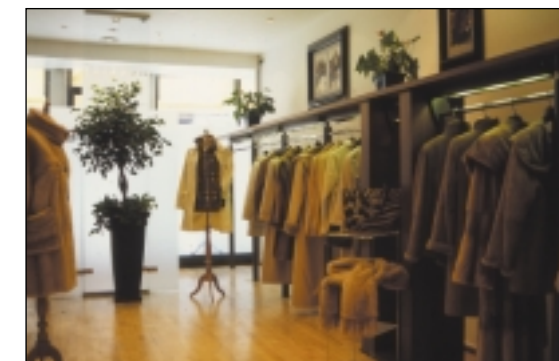
Boutique de Peletería

La fabricación de todas las prendas de piel, combinación con prendas y prendas con adornos en piel, tiene lugar en todo el mundo. Hoy, las prendas de piel y accesorios llegan al consumidor final a través de una extensa gama de vendedores al por menor: peleterías especializadas, grandes almacenes y boutiques de moda.