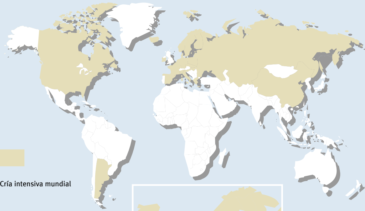
Cría intensiva mundial